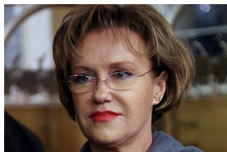
Ирина Розанова откровенно об отъезде из