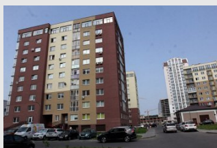
Как устанавливаются членские взносы в ТС?