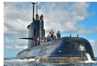
Мгновенно и без страданий: аргентинскую