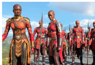
Самые страшные женщины на земле