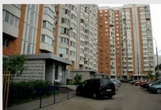
Как платить взносы в товариществе собственников?