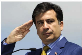
Журналисты показали, как Саакашвили живет в