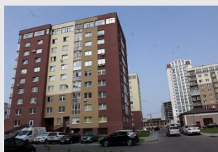
Как снизить затраты в товариществах собственников?